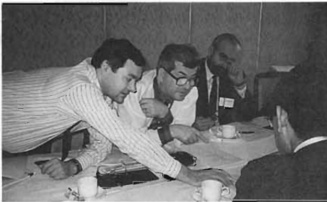
写真 熱心な議論風景

会議は2月と3月に各々約10日間の日程で、東海村で開催した。日本からは日本原子力研究所（原研）、動力炉・核燃料開発事業団（動燃）、日本原子力発電（原電）、日本原燃（原燃）、RANDECの専門家が参加し、活発な意見や情報の交換を行った。また、3月に来日した廃棄物処分と安全規制の専門家グループは、青森県六ヶ所村の低レベル放射性廃棄物処分場等の視察も行った。