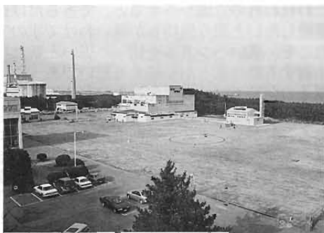
写真2 解体後のJPDR敷地