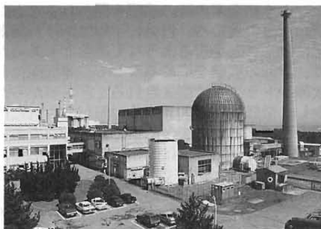
写真1 解体前のJPDR全景

一方、通産省資源エネルギー庁は、原子力発電所の廃止措置の現実化に備え、先に原子力委員会が決定した「運転を終了した原子力発電所の施設は最終的に解体撤去する」という基本方針にそって、現実の技術水準を踏まえ廃止措置方策を検討するため、「原子炉廃止措置対策小委員会」を平成8年3月再開しました。JPDRを対象として実施された解体技術開発及び解体実地試験により得られた技術やデータが発電用原子炉の廃止措置に有効に利用されることが期待されています。